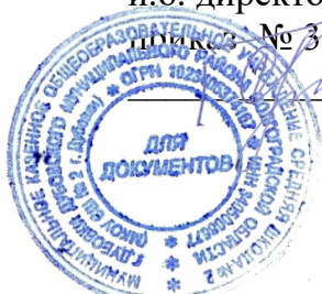
График оценочных процедур в МКОУ СШ №2 г. Дубовки на I полугодие 2024-2025 учебного года ноябрь