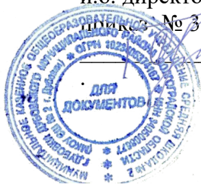
График оценочных процедур в МКОУ СШ №2 г. Дубовки на I полугодие 2024-2025 учебного года декабрь